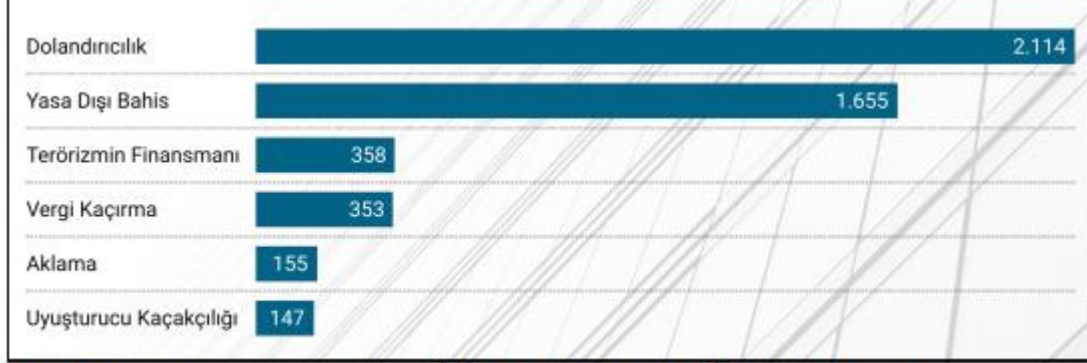
2024 Yılı Erteleme Kararı Verilen İşlemlerin Suç Türleri İtibarıyla Dağılımı

2024 yılında erteleme kararı verilen işlemlerin suç türlerine göre dağılımı aşağıdaki tabloda verilmiştir.